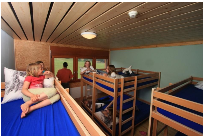
Schlafsaal mit 10 Betten