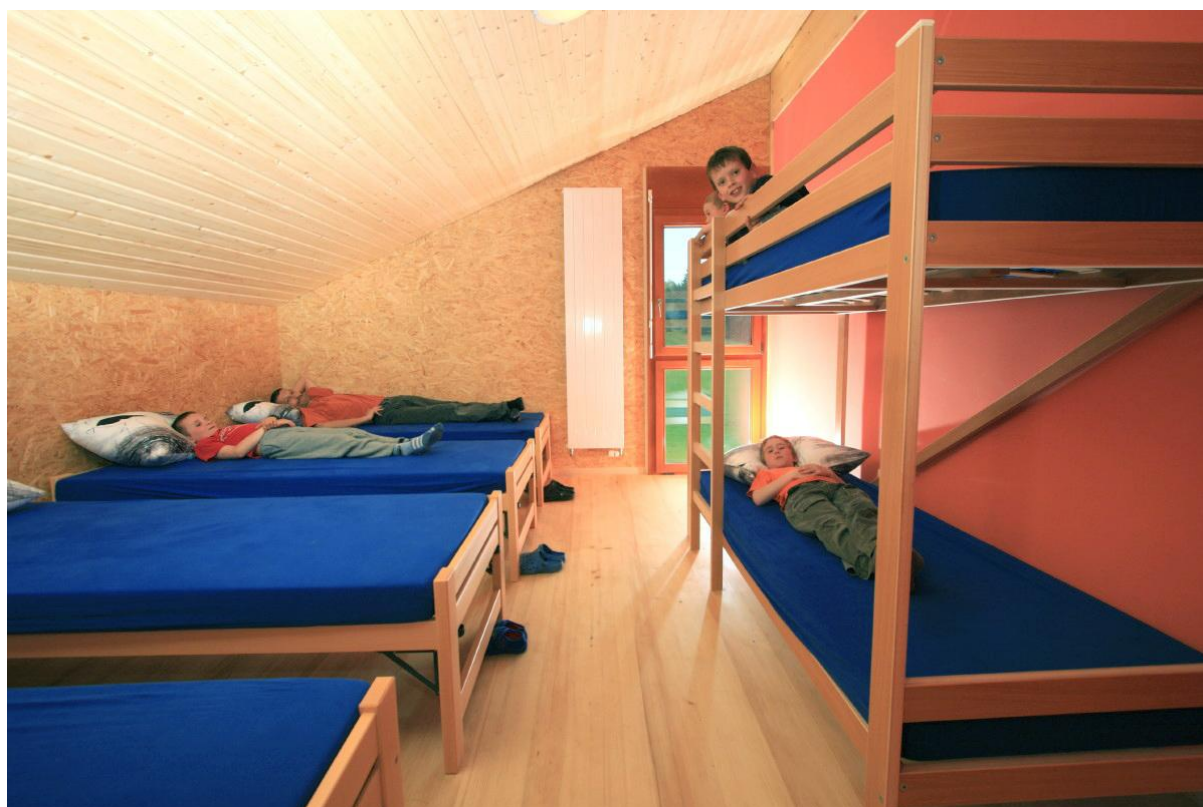
Schlafsaal mit 4 bis 6 Betten