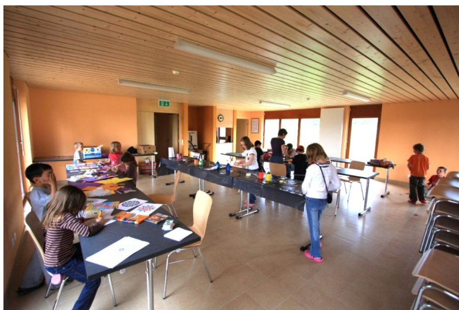
Speisesaal mit 70 Plätzen