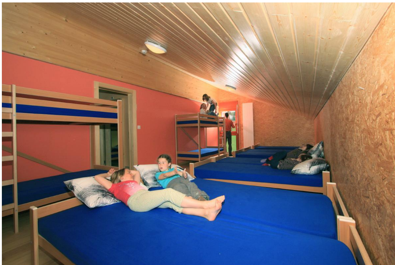
Schlafsaal mit 12 Liegen